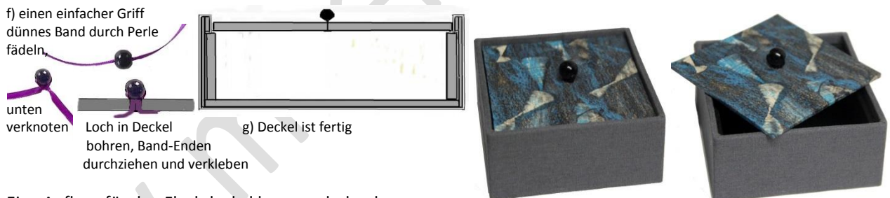
g) Deckel ist fertig

Eine Auflage für den Flachdeckel kann auch durch verschiedene Einsätze in der Schachtel gestaltet werden