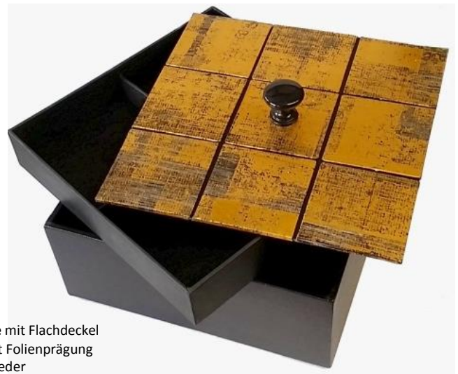
Schmuckkassette mit Flachdeckel Kleisterpapier mit Folienprägung schwarzes Kunstleder zwei Einsätze innen, oberer mit Einteilung