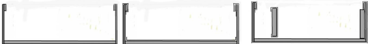
a) Kasten zusammensetzen, Pappstreifen

Deckel passend zuschneiden, überziehen, Griff (f) anbringen und auf Rückseite auskleben (g).