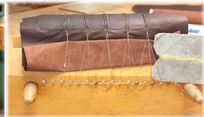
Buchrücken in Blockpresse eingeledert

Leder auf Buchdeckel schlagen und verleimen, an der Rückseite Schließenriemen einarbeiten und alle Einschläge einschlagen; kleine Blinddruckverzierung anbringen und alle Buchbeschläge annageln; Vorsatzfalz hochziehen und Vorsatz-Spiegel einkleben.