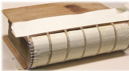
Kapital ist gestochen, Holzdeckel angesetzt

Kapitalstechen, Holzdeckel vorbereiten (zuschneiden, in Form arbeiten), Holzdeckel ansetzen an Hanfschnüre, Buchrücken aufbauen, Scheinbünde aufkleben, Leder zuschneiden, Buchrücken einledern und Scheinbünde abbinden;