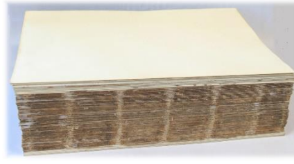
Buchblock fertig zum Heften alte Bünde Einteilung ist sichtbar