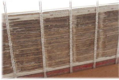
Buchblock ist geheftet, fertig zum Ableimen