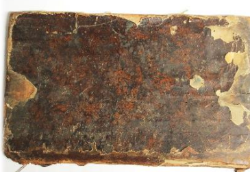
Vorderdeckel mit Buchrücken Rückdeckel, Wurzelmarmorpapier,