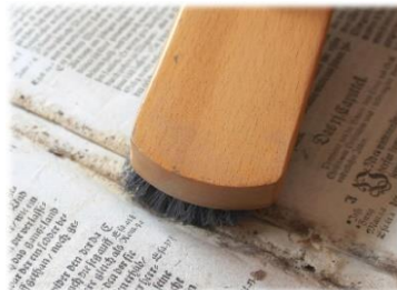
Schmutz auskehren trockenes Ausbessern in der Mitte der Bibel