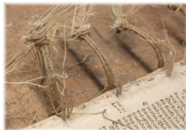
Bibel ist fast in einzelne Heftlagen zerlegt Angefaserter Blätter am Anfang und Ende

Buchblockmitte nur mit Japanpapier ausbessern, Heftlagen glätten und Heftlagen heftfähig machen.