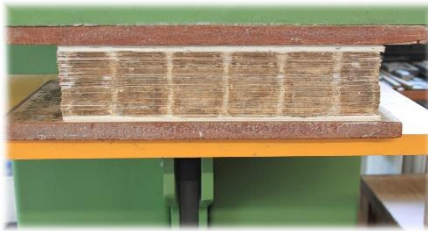
Vorgerichteter Buchblock wird eingepresst, Luft ausgepresst

Vorsatz bilden, ¼ Bogen Antik-Vorsatzpapier, Pergamentfalz umhängen; vorgerichteter Buchblock im Stapel einpressen, heften auf der Heftlade auf Doppelbünde (Hanfschnur), kleistergeben und ableimen, abpressen;