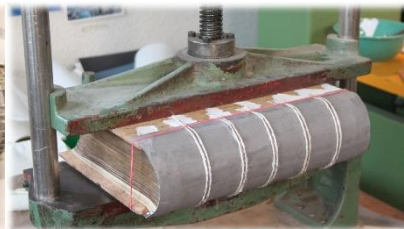
Buchrücken wird aufgebaut