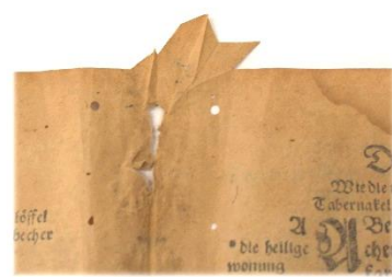
starker beschnitten, sichtbar an einer Falte am Heftlagenrücken