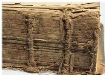
Buchblock (Fuß), angeschnittener Fitzbund, alte Doppelbünde

im 19. Jahrhundert wurde Buch stark beschnitten, Fitzbünde sind angeschnitten, Heftlagen werden mit Heftschnüren durch Bundsteg zusammen genadelt und um die alten Heftbünde verankert