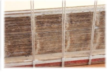
wird geheftet auf Doppelbünde auf der Heftlade