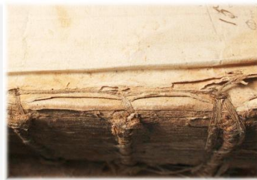
seitlich durch Bundsteg genadelt um Heftbünde verankert,