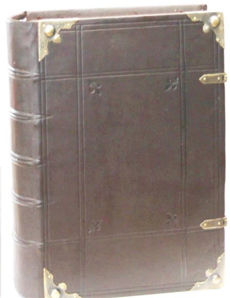
Blinddruckverzierung, Buchbeschläge annageln, Schließen Riemen mit Deckplättchen