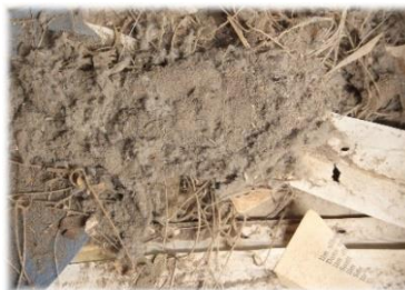
Schmutz der Bibel, Trockenreinigung angefaserte Blätter ebarbieren