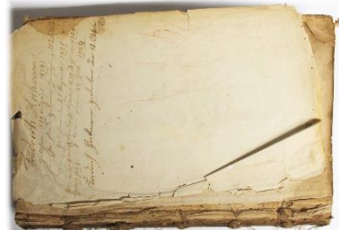
Vorsatz fliegendes Blatt

Vorsatz: Spiegel und fliegendes Blatt zusammenhängend (1/4 Bogen), holzhaltiges Papier (19. Jahrhundert), ältere Vorsatzblätter Büttenpapier vorgeheftet mit Familieneintragungen, drei Blatt.